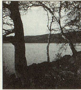
Die ganze Schöpfung war Gesang Kiefel