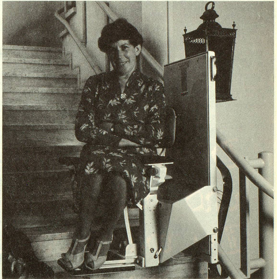
TLG Treppenlift in einem Einfamilienhaus

TLG Treppenlifte werden in der Schweiz hergestellt. Dank den verschiedenen Regionalvertretungen und Servicestellen in der ganzen Schweiz ist der zuverlässige Betrieb und der tadellose Unterhalt gewährleistet.