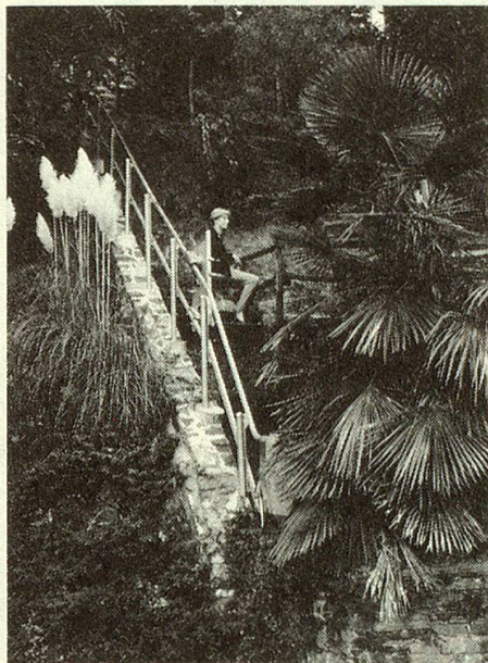
TLG Aussenanlage, transportiert Personen und Gepäck im Freien

Die abgebildete Anlage führt über zwei Treppen ins obere Stockwerk, wo sich Schlaf- und Badezimmer befinden. Sie ist mit Klappsitz und kleiner Plattform ausgerüstet. Der Antrieb,