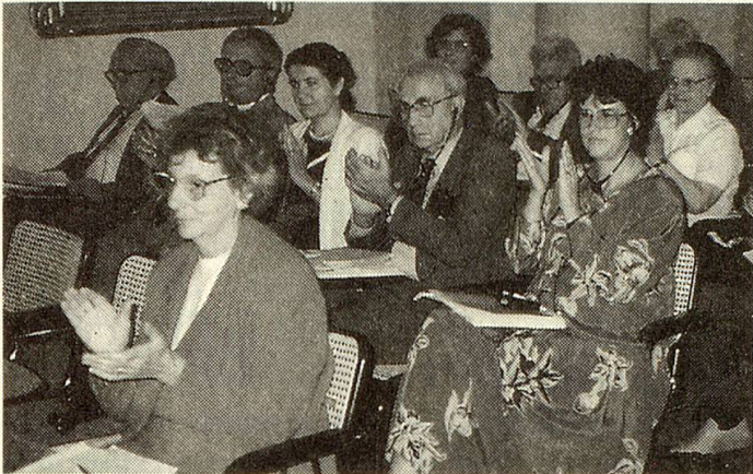
Beifall der Abgeordnetenversammlung nach dem Referat von Prof. Ursula Lehr.