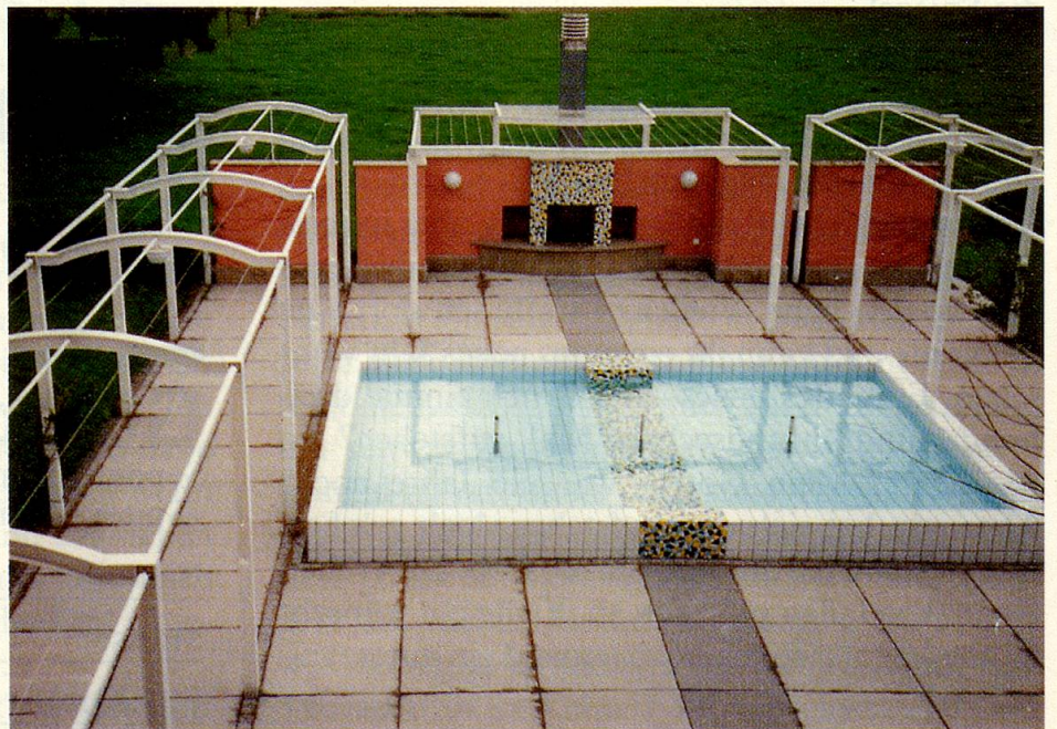
Die Gemeinschaft «Mitternachtsruf» finanzierte das Heim ausschliesslich durch Spendengelder. Es steht inmitten eines gepflegten Gartens mit Swimmingpool und Barbecue-Grill.

Wer sich dem Altersheim Zion in Dübendorf auf der stark befahrenen Strasse mitten durch das Industrieviertel nähert, der glaubt eher, ein Hotel vor sich zu haben als ein Altersheim: Das rosa Gebäude mit weissen Balkonen inmitten eines hübschen, gepflegten Gartens mit Swimmingpool und Barbecue-Grill fällt neben den vielen Zweckgebäuden wohltuend auf. Ein junger Architekt hat hier ein äusserst grosszügiges Heim bauen können. Es wurde ausschliesslich durch Spendengelder finanziert. Die Gemeinschaft «Mitternachtsruf» brauchte dazu keine staatlichen Subventionen.