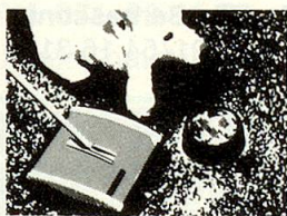
HOKY schluckt alles: Brosmen, Fusseln, selbst Hunde- und Katzenhaare.