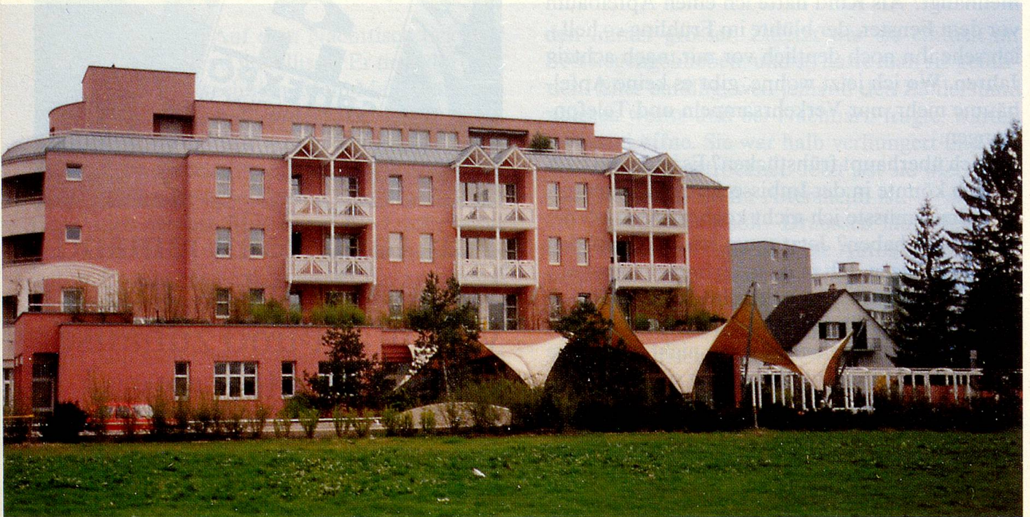
Das Altersheim «Zion» in Dübendorf