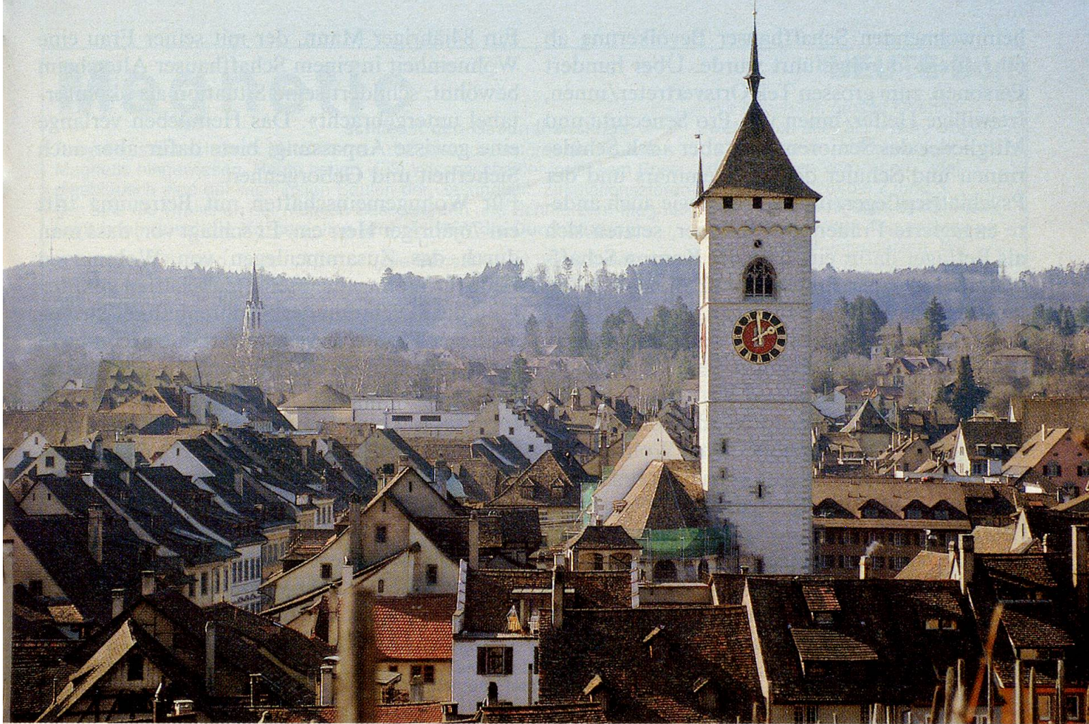
Schaffhausen: Beinahe 20% der Bevölkerung gehören zu den Senioren.