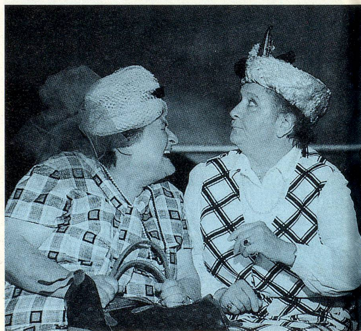
Auch das Senioren-Theater gehört zu den Aufgaben des Seniorenrates.