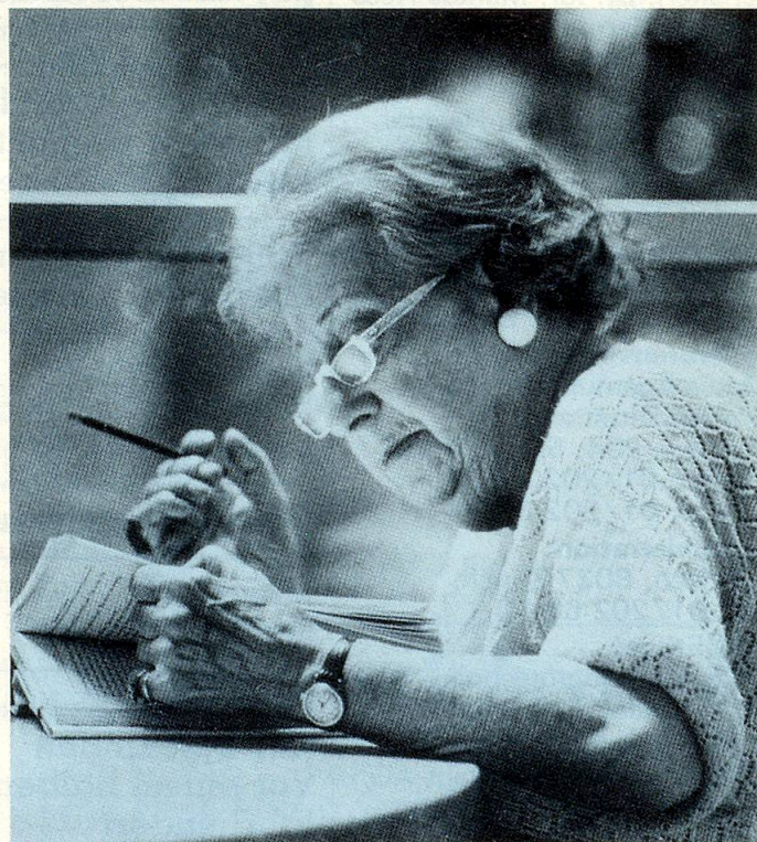
... und Sachkenntnis für die Senioren in Schaffhausen ein.

nerinnen, Krankenschwestern und eine Regisseurin.