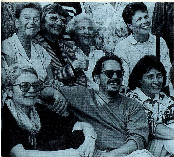
Die «Zusammenarbeit» des Seniorenrates mit der jüngeren Generation klappt auch auf anderen Gebieten.