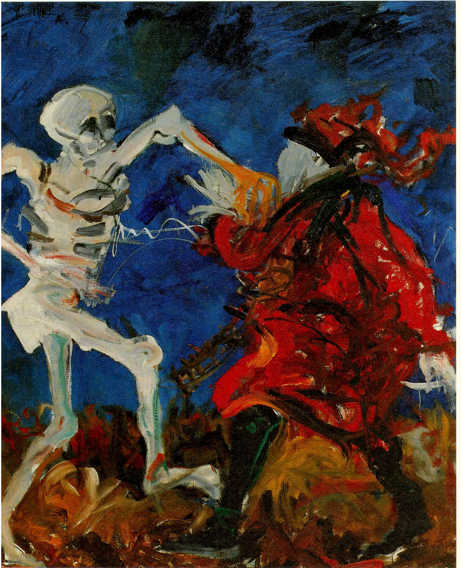
«Der Tod zum Heiden», Acrylbild von Herwig Zens, aus dem Projekt Basler Totentanz, Historisches Museum Basel.