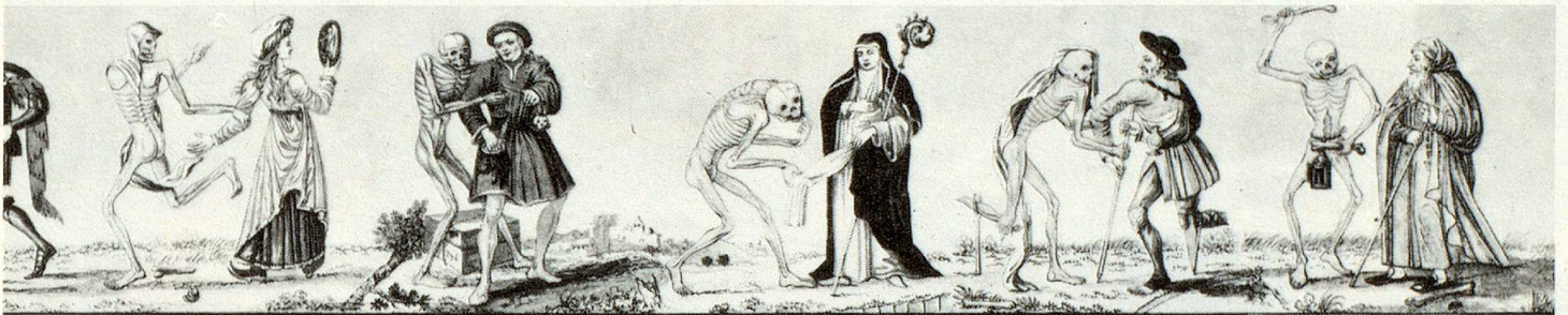
Imam. Der Tod zur Edelstau. Der Tod zum Kaufmann. Der Tod zum Klebsien. Der Tod zum Krüppel. Der Tod zum Wälbruder.

Die Kopie des ursprünglichen Basler Totentanzes von Johann Rudolf Feyerabend (nach Matthäus Merian) diente Herwig Zens als Vorlage. Zusammengestellt ergeben die 40 Bilder des neuen Basler Totentanzes einen Fries von 52 Metern Länge.