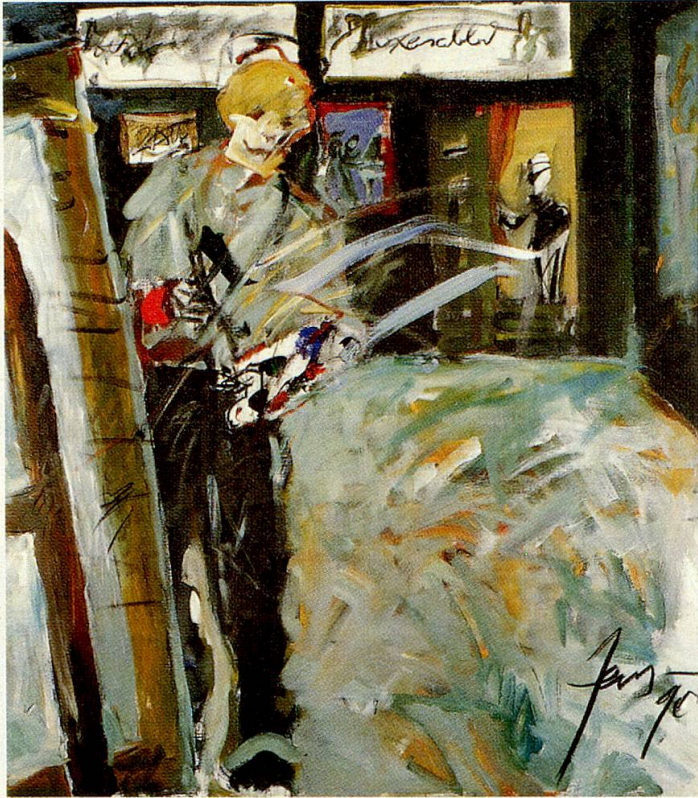
Das Schlussbild des neuen Basler Totentanzes: Wen der Maler – in der Gestalt des Todes – porträtiert, bleibt dem Betrachter verborgen. Doch der Maler blickt aus dem Bild...

Es erstaunt nicht, dass gerade Künstler sich immer wieder gegen unseren Umgang mit dem Sterben auflehnen und sich um eine eigene Bewältigung bemühen.