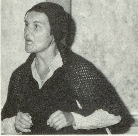
Szene aus «Patriot Hungerbüeler»