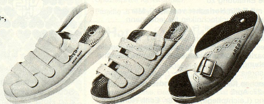
AREG® Modell 1

Echt Leder, Grössen 36–47 in weiss, dunkelbraun und lackschwarz, jedes Paar SFr. 170.–