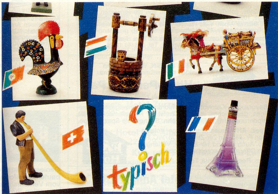
Jedes Land hat seine eigenen Wahrzeichen

Die Ausstellung bietet aber nicht nur einen Überblick solcher Identifikationsmerkmale und Wahrzeichen, die von Gebrauchsgegenständen über Nippsachen, staatliche Embleme und Musik bis zu lokalen Spezialitäten reichen, sondern versucht, das Thema aus volkskundlicher Sicht aufzubereiten: Was ist der Anlass, dass Gegen-