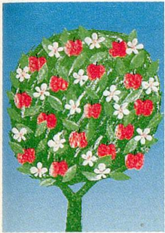
Grafik: Orto Galli

Oktober/November 1991, 69. Jahrgang, Nr. 5