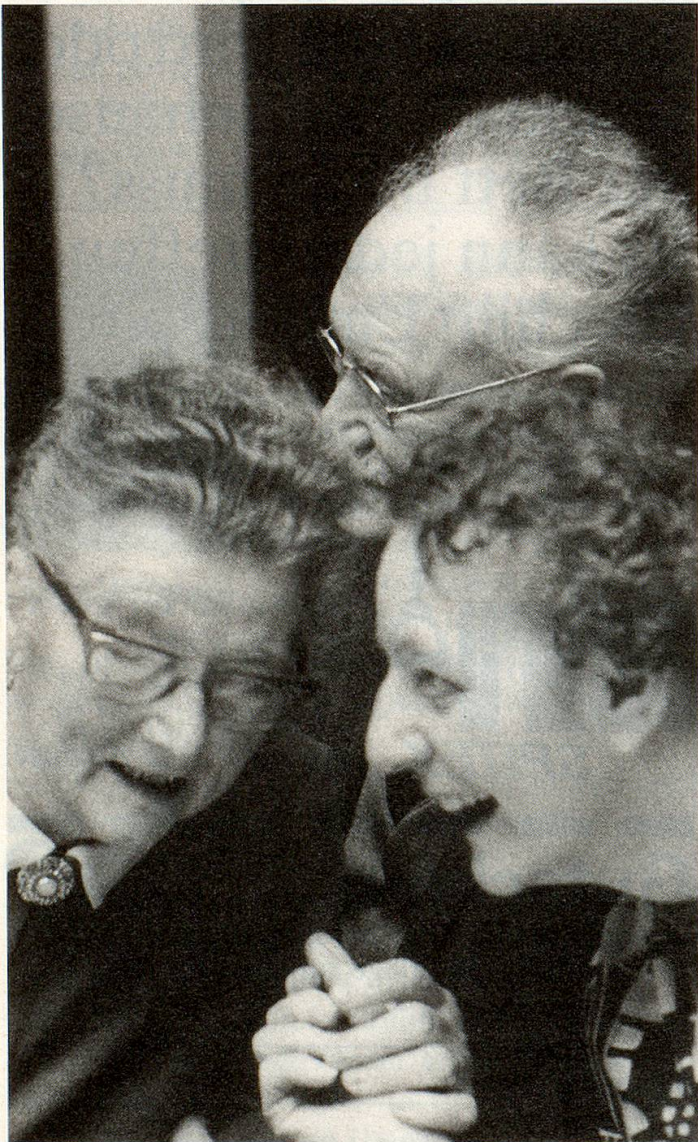
Das Gehör: Voraussetzung ungezwungener Kommunikation. Plötzlicher Verlust kann in die Isolation führen.

Ein Spät-Ertaubter erzählte mir, dass er eines Morgens erwacht sei und nichts mehr gehört habe. Damit habe für ihn ein neuer Lebensabschnitt begonnen. Normalerweise trifft die plötzliche Ertaubung – auch Hörsturz genannt – nur ein Ohr. Doch tragischerweise hörte er vor seinem Hörsturz schon auf dem anderen Ohr nichts mehr. Meistens, allerdings nicht immer, geht das Ereignis einher mit einem starken Ohrengeräusch, aber ohne Schwindel. Ein Begleitschwindel zu einem plötzlichen Hörverlust gehört zu anderen Erkrankungen.