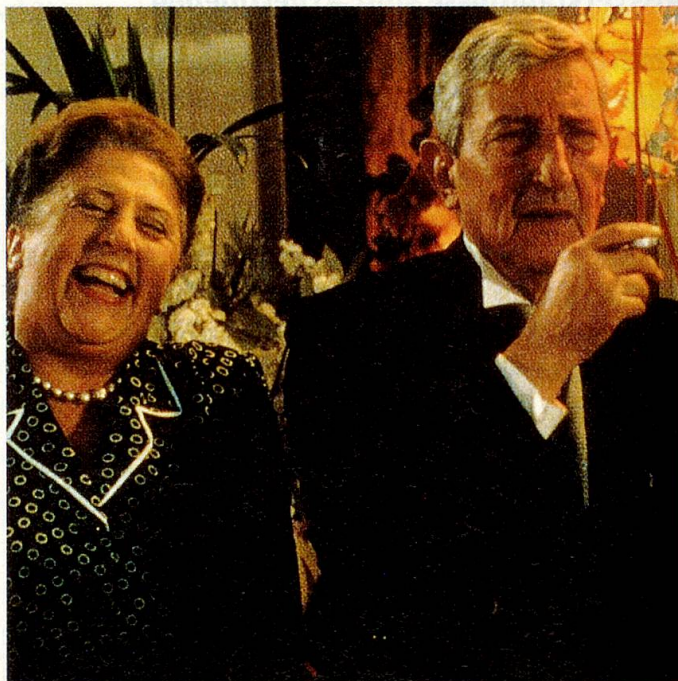
Die Grosseltern: Seele des Hauses.