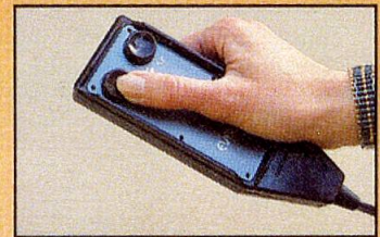
Das elektrische Steuergerät (auf Wunsch).