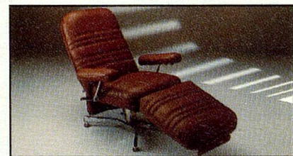
Everstyl „Trocadero“, zeitlos modern