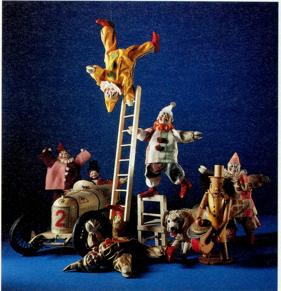
Blick ins Spielzeugmuseum Riehen.

Die Ausstellung findet in einem Zelt im Hof des Landesmuseums, Zürich (beim Hauptbahnhof) statt. Sie dauert vom 26. Juni bis 11. Oktober und ist täglich von 10 bis 17 Uhr, am Donnerstag bis 20 Uhr geöffnet. Der Eintritt kostet Fr. 8.–, Kinder, Militär und Personen mit AHV-Ausweis Fr. 4.–.