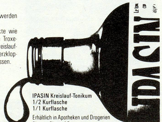
IPASIN Kreislauf-Tonikum 1/2 Kurflasche 1/1 Kurflasche Erhältlich in Apotheken und Drogerien Pharma Singer AG