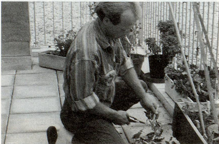
Herbstarbeiten. Es blüht auch auf dem Dach.