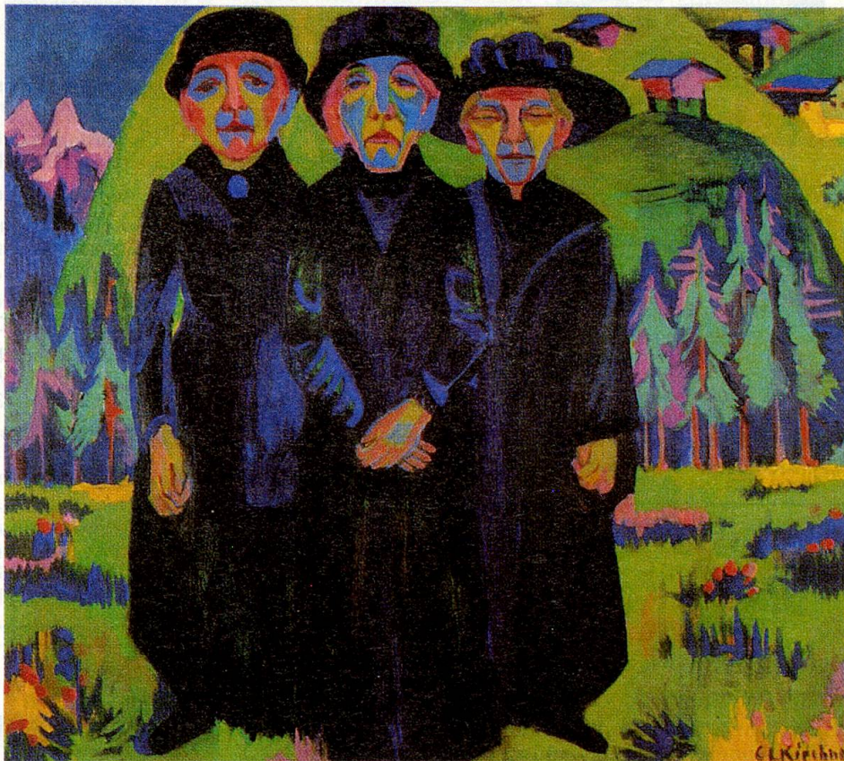
Ernst Ludwig Kirchner: Die drei alten Frauen (1925/26), Kirchner Museum Davos.

Die Broschüre kann zum Preis von 10 Franken bei der Schweiz. Vereinigung für Ernährung, Postfach, 3052 Zollikofen, bestellt werden.