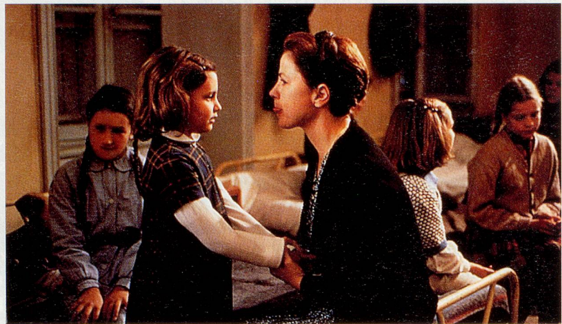
Ein Film gegen das Vergessen: «La Colline aux mille enfants»