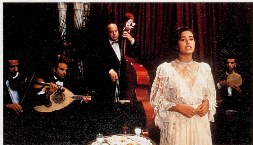
Das Schweigen der Frau – nicht nur im Islam: «Les silences du palais»

der Greuelthaten aktueller Kriegsgeschehen leicht vergessen wird, war ein Ereignis, das die europäische Geschichte unseres Jahrhunderts wesentlich geprägt hat. Er darf niemals vergessen werden. Diese «wahre» Geschichte ist aber auch ein Beispiel, dass es immer wieder auf den einzelnen ankommt, ob in der Welt Glück oder Leid herrscht.