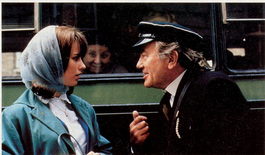
A Man of no Importance