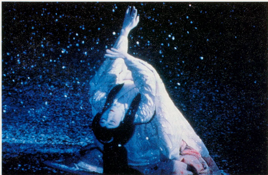
Das geschriebene Gesicht

«Das geschriebene Gesicht» verlangt Offenheit für Neues, Ruhe, Schweigen und die Bereitschaft zur Meditation. So kommen wir in seinen Bild- und Ton-