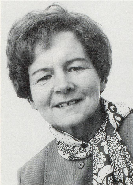
1970 als Gemeinderätin