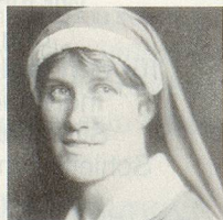
Zum «Erinnern Sie sich noch?» aus Heft 5/98

Schicken Sie Vorname und Name von Richard Wagners Zürcher Muse bis am 25. August 1998 auf einer Postkarte an: Zeitlupe, Rätsel, Postfach, 8099 Zürich.