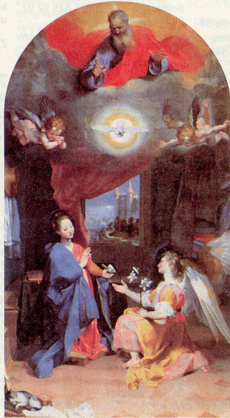
Die Verkündigung von Frederico Barocci (1535–1612) aus der Basilika Santa Maria degli Angeli in Assisi.

Die Erdbeben von 1997 in Assisi und Umgebung lösten auf der ganzen Welt Erschütterung aus. Es wurden nicht nur die Häuser von Tausenden von Menschen zerstört, sondern es gingen unschätzbare Kulturgüter verloren. Aus vielen Kirchen und Museen mussten die Kunstwerke entfernt werden, um renoviert oder bis zum Instandstellen der Gebäude gelagert zu werden. Dem freiburgischen Städtchen Payerne ist es gelungen, einige bedeutende Werke aus diesen umbrischen Depots in ihre romanische Abteikirche zu holen, wo sie nun bis zum 30. August 1998 bewundert werden können. Die rund 60 ausgestellten Werke dokumentieren Höhepunkte der italienischen Gotik und Renaissance. Von den Fresken entstammen einige dem Atelier Giotto, von den Gemälden einige der Werkstatt Caravaggio. Es ist das erste und bis auf weiteres das einzige Mal, dass diese Kunstschätze Italien verlassen. Eine würdigere und schönere Ausstellungsstätte als Payernes schlichte «Abbatiale» kann man sich für die sakralen Bildwerke weder wünschen noch vorstellen.