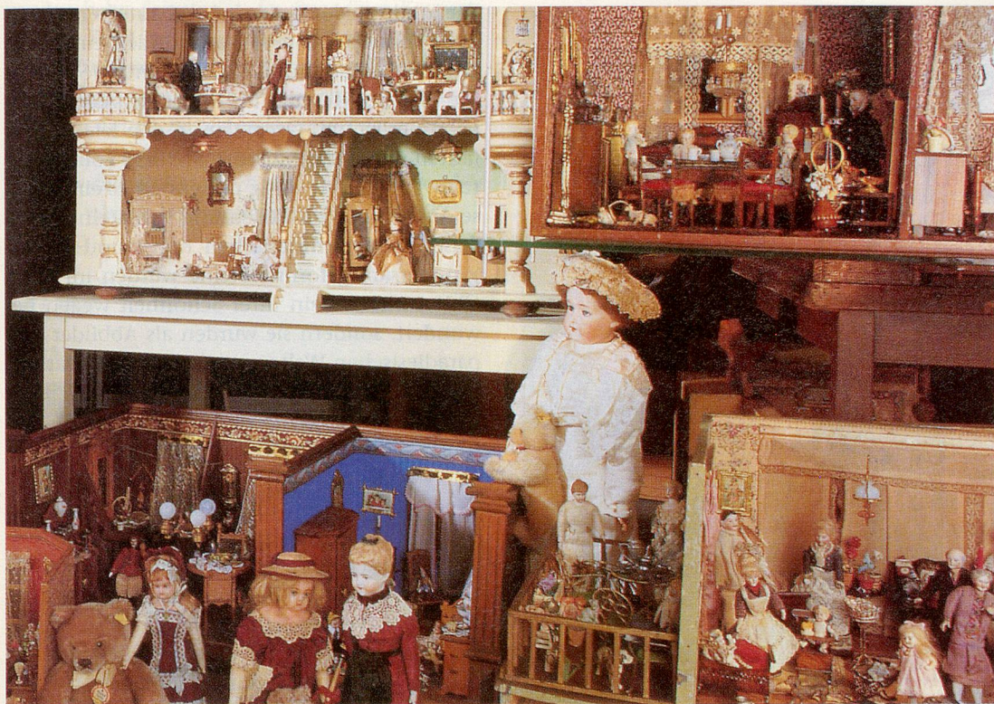
Teddybären, Puppen, Kaufmannsläden und Puppenhäuser im Herzen von Basel.

Wer auch könnte besser Auskunft geben auf all die Fragen aus dieser Zeit von Anfang 19. Jahrhundert bis heute! Manch älterer Besucher taucht beim Betrachten in eigene Kindheits-erinnerungen ein und vergisst vorübergehend den Alltag. Lustig, witzig und zum Teil auch keck werden Situationen aus der damaligen Kinderwelt dargestellt: zwei Bärchen liegen am Boden und kämpfen miteinander. Kissenschlachten lassen die Federn fliegen, ein kleines Bärenmädchen steigt seinem grossen Bruder auf die Schultern, um in ein verbotenes Fenster sehen zu können – eine Sammlung aus rund 6000 Exponaten, davon über 2000 Teddybären. Der älteste Teddy stammt aus dem Jahr 1904. Alle namhaften Teddybären-Hersteller aus der ganzen Welt sind in diesem Museum, dem grössten dieser Art in Europa, vertreten. Die meisten Ausstellungsstücke stammen aus der Zeit um 1870 bis 1920.