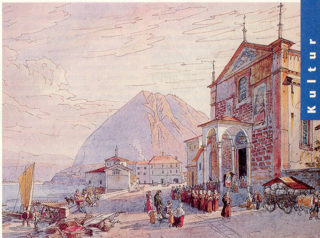
Gabriel Lorys spätbarocke Vedute zeigt den bis heute fortbestehenden Charme von Lugano. (Museo cantonale d'arte Lugano)

Gesichter: die harten und korrupten Herrscher wurden gleichzeitig als Beschützer wahrgenommen. Als sich Ende des 18. Jahrhunderts auch in der Südschweiz revolutionäre Umtriebe bemerkbar machten, wollte nur die städtische Elite etwas von Selbständigkeit, Befreiung und Demokratie wissen. Vor allem der Klerus fürchtete das Ende seiner Macht.