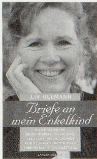
Liv Ullmann Briefe an mein Enkelkind Langen Müller-Verlag München, 156 S., Fr. 27.50

Liv Ullmann, Schauspielerin, Regisseurin und Lebensgefährtin von Ingmar Bergman, hat sich seit Beginn ihrer Karriere für bedürftige Kinder eingesetzt und ist seit 1980 Sonderbotschafterin des Kinderhilfswerks Unicef. Sie hat nun dieses Buch herausgegeben, dessen gesamtes Honorar der «Woman's Commission for Refugee Women and Children» zukommt. Allerdings stammen die Briefe nicht von Liv Ullmann selbst, vielmehr kommen einige namhafte Autoren und Autorinnen zu Wort. Diese äussern zum Teil recht offen und ehrlich ihre Gedanken und Wünsche an die kommende Generation. Obwohl sich manche dieser Briefe nicht an eigene Kinder oder Enkelkinder richten, werden doch immer ganz persönliche Meinungen offenbart. Thor Heyerdahl zum Beispiel fordert junge Menschen auf nachzuziehen, was Eltern und Grosseltern versäumt haben. Harry Belafonte lernte dank seiner Enkeltochter seine Umwelt mit andern Augen zu sehen. Und Dalai Lama überrascht mit einer warmherzigen Botschaft. Die Briefe berühren, weil sie nicht nur sehr persönlich sind, sondern auch mit viel Moral, Strenge, Liebe und Zärtlichkeit abgefasst sind. tkb