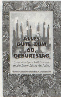
Verschiedene Autoren Alles Gute zum 60. Geburtstag Einen herzlichen Glückwunsch zu den besten Jahren des Lebens Richarz Geschenkbibliothek CW Niemeyer, 132 S., Fr. 14.–

Liv Ullmann, Schauspielerin, Regisseurin und Lebensgefährtin von Ingmar Bergman, hat sich seit Beginn ihrer Karriere für bedürftige Kinder eingesetzt und ist seit 1980 Sonderbotschafterin des Kinderhilfswerks Unicef. Sie hat nun dieses Buch herausgegeben, dessen gesamtes Honorar der «Woman's Commission for Refugee Women and Children» zukommt. Allerdings stammen die Briefe nicht von Liv Ullmann selbst, vielmehr kommen einige namhafte Autoren und Autorinnen zu Wort. Diese äussern zum Teil recht offen und ehrlich ihre Gedanken und Wünsche an die kommende Generation. Obwohl sich manche dieser Briefe nicht an eigene Kinder oder Enkelkinder richten, werden doch immer ganz persönliche Meinungen offenbart. Thor Heyerdahl zum Beispiel fordert junge Menschen auf nachzuziehen, was Eltern und Grosseltern versäumt haben. Harry Belafonte lernte dank seiner Enkeltochter seine Umwelt mit andern Augen zu sehen. Und Dalai Lama überrascht mit einer warmherzigen Botschaft. Die Briefe berühren, weil sie nicht nur sehr persönlich sind, sondern auch mit viel Moral, Strenge, Liebe und Zärtlichkeit abgefasst sind. tkb