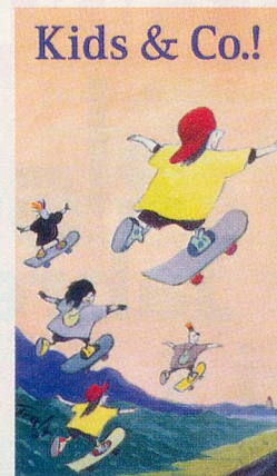
Cartoon oder Karikatur? (Zeitlupe 12/97, S. 68)

Unzählige Leser Ihrer Zeitschrift sind entrüstet über Ihr Inserat «Kids & Co.» Warum nur propagieren Sie Ihre «Cartoons» nicht in unserer schweizerischen, für alle verständlichen Sprache? «Kids & Co.»? Soll die englische Ausdrucksweise wirksamer sein? Die Leser beziehungsweise Kunden sind anderer Meinung und meiden solche Propaganda-Käufe. Warum nennen Sie Cartoons nicht Karikaturen? Dürfen wir zukünftig auf Verzicht solcher Werbung wirtschaftlicher Zwecke rechnen?