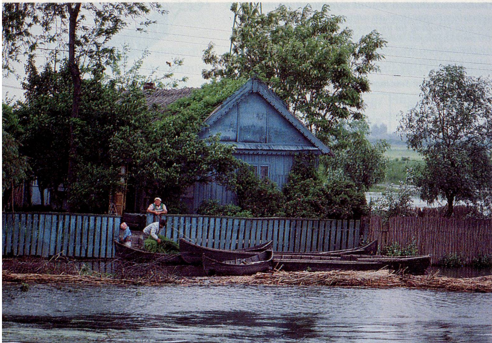
Reise in eine Welt von gestern: Fischerdorf Mile im rumänischen Donaudelta.