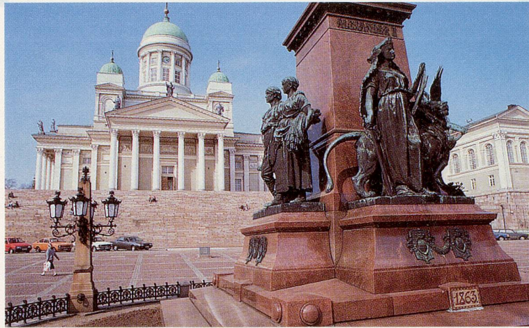
Reiseziel Finnland: Der Senatsplatz von Helsinki mit dem Denkmal von Alexander II. und dem Dom.

Der in der Schweiz führende Skandinavien-Spezialist Glur offeriert – aus Anlass seines 20jährigen Bestehens – diverse Kurzreisen nach Skandinavien mit 40 Prozent Rabatt. So zum Beispiel eine Reise nach Oslo vom 18. bis 20. April für 630 statt 1050 Franken. Inbegriffen sind Swissair-Flug Basel/Zürich–Hamburg, Bahnbillett Hamburg–Kiel, die Schiffsreise mit Color Line ab Kiel nach Oslo, Übernachtung im Rica Oslo Hotel mit Morgenessen und Swissair-Retourflug Oslo–Zürich/Basel. Ebenso stehen im Mai ein Frühlingswochenende in Helsinki für 501 statt 835 Franken und im Juni für 588 statt 980 Franken ein Flug nach Helsinki mit anschließender Schiffsreise von Silja Line nach Stockholm, der diesjährigen Kulturstadt Europas, auf dem Programm. Bis Ende Jahr wird jeden Monat eine andere Spezialreise angeboten.