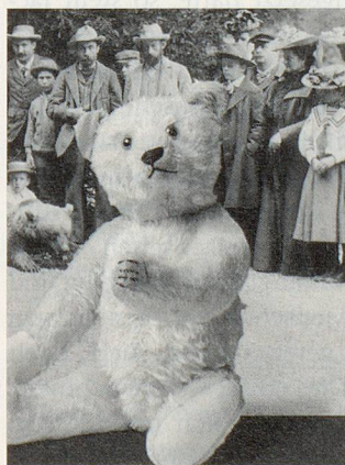
Das Museum in der Burg in Zug ist zugänglich Di bis Fr 14–17 Uhr, Sa und So 10–12 und 14–17 Uhr, 041 728 32 97.