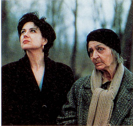
Bild aus dem Spielfilm «Le acrobate»

Alle Jahre werden Ende Januar an den Solothurner Filmtagen die Produktionen des freien Schweizer Filmschaffens gezeigt. Diesmal waren es 121 Spiel-, Dokumentar- und Trickfilme. Wer das Angebot mit der Frage nach dem Bild des Alters im Hinterkopf angeschaut hatte, konnte feststellen, dass es Alte auf der Leinwand gibt, dass Alter im Kino stattfindet, wenn auch zahlenmässig extrem unterdotiert. Im Gegensatz zu den Filmen früherer Jahre, in denen das Alter als «Problem» und die Alten als «Fall» dargestellt wurden, erscheinen sie heute meist als normale Menschen in normalen Rollen. In der letzten Zeit tritt vermehrt «Altern» an Stelle von «Alter» in den Mittelpunkt, vielleicht auch das Zeichen einer gewissen «Normalisierung». – Dazu fünf Beispiele aus dem Programm, die ins Kino kommen: drei Dokumentar- und zwei Spielfilme.