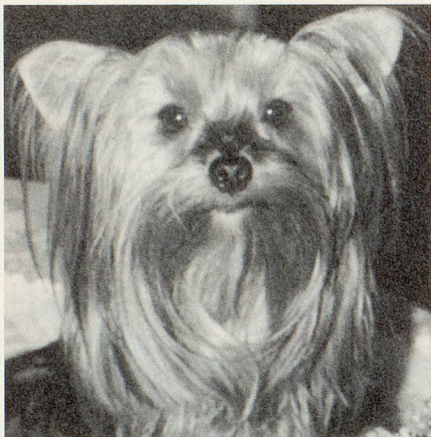
Das Terrier-Hündchen Zaila

Wieder einmal war es schwierig, aus den zahlreichen und teilweise sehr rührenden Briefen eine Auswahl zu treffen. Diesmal hatten wir sogar die Qual der Wahl von Fotos. Viele unserer Leserinnen und Leser hängen offensichtlich sehr an ihren Haustieren und freuten sich, dass sich die Zeitlupe diesem Thema angenommen hat. Vereinzelt gab es jedoch auch kritische Stimmen zur Tierliebe.