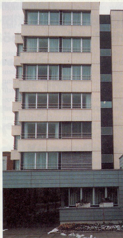
Dank grosser Fenster sind viele Zimmer im Pflegezentrum «Seematt» sehr hell.