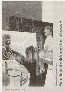
Joachim Küchenhoff (Hrsg.) Familienstrukturen im Wandel Friedrich Reinhardt Verlag, Basel, 180 S., Fr. 38.–

Die veränderten Formen des Zusammenlebens, wie sie im Schwerpunktthema dieser «Zeitlupe» beschrieben werden, wirken sich in vielfältiger Art auch auf die betroffenen Gruppen und Individuen aus. So wird zum Beispiel die Familiendynamik – die strukturellen Kräfte innerhalb der Familie – in der Familientherapie zum Thema, und Pädagogen und Pädagoginnen gehen den Bedingungen der kindlichen Sozialisation in den veränderten Familienstrukturen nach. Soziologen können die Wechselwirkungen zwischen gesellschaftlichen Entwicklungen und familiärem Wandel beschreiben, Psychiater setzen sich mit den Folgen belasteter, spannungsvoller familiärer Lebensverhältnisse auseinander. In diesem Buch setzen sich namhafte Fachvertreter/innen der Geschichtswissenschaften, der Soziologie, der Theologie, der Pädagogik, der Psychiatrie und Psychoanalyse mit dem Thema auseinander. Durch das Zusammenspiel der verschiedenen Richtungen und Betrachtungsweisen wird ein Bild der Gesellschaft gezeichnet, das spannend ist und vermutlich der Wirklichkeit sehr nahe kommt. zk