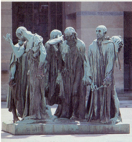
Die Bürger von Calais im Hof des Kunstmuseums Basel.

Dass sich zwischen Basel und Winterthur die bedeutendste Konzentration impressionistischer Werke ausserhalb von Paris befindet, wissen nur Wenige. Damit sich dies ändert, hat Schweiz Tourismus die Vereinigung Kunsttourismus Schweiz gegründet. Unter der Leitung ihrer Präsidentin Helga von Graevenitz soll als erstes Angebot der Nachteil dieser Dezentralität mit dem Motto «eine Reise zu Spitzenwerken des Impressionismus» ausgeglichen werden. Kunstinteressierte können somit von Basel oder Winterthur aus eine faszinierende Fahrt durch den Impressionismus unternehmen. Dazu stellt ein spezieller Farbprospekt die Reise inhaltlich vor, liefert interessante Angaben zu Museen und Epoche und vermittelt alle relevanten Informationen wie Adressen von Hotels, Restaurants, Cafés usw. und Preise. Die wichtigsten Stationen der Route sind das Kunstmuseum Basel, die Stiftung Langmatt Sidney und Jenny Brown in Baden, das Kunsthaus und die Stiftung E.G. Bührle in Zürich, das Kunstmuseum Winterthur sowie die dortige Sammlung Oskar Reinhart und diejenige von Hahnloser in der Villa Flora in Winterthur. Um diese Ausstellungsorte