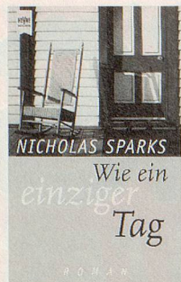
Nicholas Sparks Wie ein einziger Tag Roman Heyne Verlag, München 204 S., Fr. 12.50

«Wir haben ein Leben gelebt, von dem die meisten Paare nur träumen können, und dennoch fürchte ich, wenn ich dich ansehe, dass all dies bald zu Ende sein wird. Denn wir beide kennen den Verlauf meiner Krankheit.» Diese Worte hinterlässt die Alzheimerkranke Allie ihrem geliebten Noah in einem letzten Brief. Er soll ihn an die gemeinsam verbrachte schöne Zeit erinnern. Noah seinerseits liest Allie im weiteren Verlauf ihrer Krankheit seine alten Tagebücher vor – und lässt dadurch die Leserinnen und Leser an seiner sinnlichen Liebesgeschichte teilnehmen und den Traum von der ewig dauernden, grossen Liebe träumen.