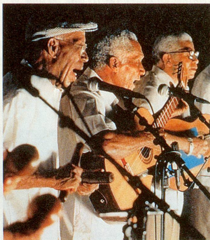
Mit kubanischer Populärmusik begeistern fünf alte Musiker auch in Europa.

Im Mai 1997 begleitete die holländische Filmerin Sonia Herman Dolz die charmanten Männer in Kuba bei den Vorbereitungen zu ihrer Europa-Tournee und bei den ersten Konzerten in England. Sie filmte sie im Kreise ihrer Familien und sprach mit ihnen über ihre Erinnerungen ans alte Kuba und seine Veränderungen. Daraus entstand ein 75-minütiger Dokumentarfilm von grosser emotionaler Wärme, der zudem gut unterhält.