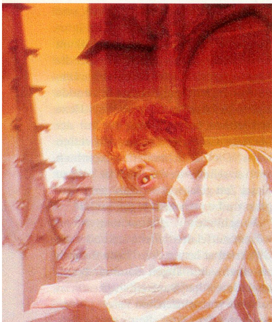
Der bucklige Quasimodo als Glöckner in Bern.

Bern war damals grösster Stadtstaat nördlich der Alpen und errichtete das bedeutendste Münster der Eidgenossenschaft. Das 15. Jahrhundert war vielerorts eine Zeit grosser Auseinandersetzungen, welche die Neuzeit nachhaltig geprägt haben. Neben den Theateraufführungen bringen historische Stadtführungen, Ausstellungen, Musikdarbietungen, Vorträge und Buchpublikationen das Leben von damals der Gegenwart näher. ny