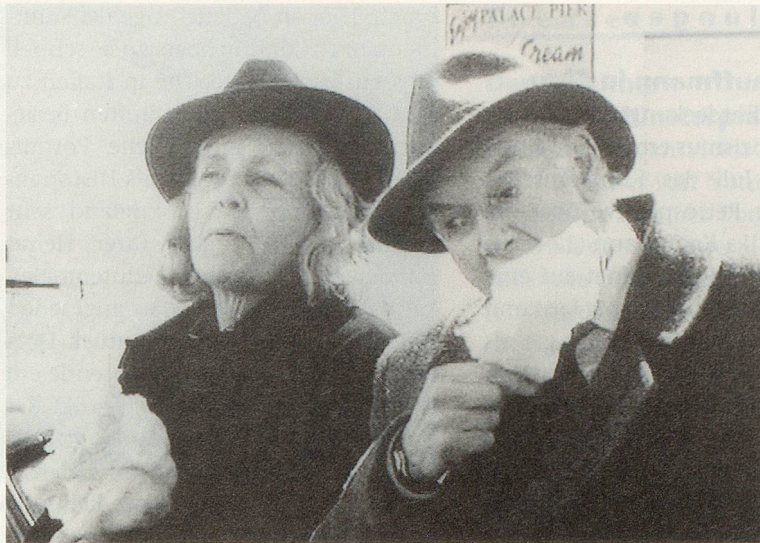
Die Hauptpersonen in der britischen Sitcom «Waiting for God»: Die grantige Diana und der lebenswerte Tom.

«Sie überlebt mit Gift, Rache und genereller Verachtung für jedermann», sagt Tom von seiner Zimmernachbarin Diana, mit der er den Lebensabend im «Bayview Retirement Home», einer Altersresidenz in Mittelengland, verbringt. Rabenschwarz ist der Humor von Diana, die das Altersheim als Pannestreifen des Lebens betrachtet, auf welchem sie nur auf den Abschleppwagen zu warten hat, der sie zur Müllhalde bringen wird. Ihr ist nichts und niemand heilig, ihrem beissenden Spott sind alle ausgesetzt: Der sparwütige und eitle Heimleiter Harvey Baines, dessen unattraktive Assistentin Jane, die hoffnungslos in ihren Chef verliebt ist, der sexbesessene Mitbewohner Basil, der ständig auf der Pirsch und hinter jedem Neueintritt her ist. Genauso böse ist Diana aber auch zu Toms langweiligem Sohn Geoffrey, der sich höchstens für die Holzmaserung norwegischer Kiefern interessiert, und zu dessen Frau Marion, die tablettensüchtig und alkoholabhängig ist. Auch «Seiner Merkwürden», dem Ortspfarrer, der seinen Glauben zu verlieren droht, gibt Diana ihren guten Rat: «Bloss weil sie Pfarrer sind, brauchen sie noch lange nicht jeden Bekloppten zu dulden.» Statt einer neuen Aufgabe möchte sie ihm deshalb lieber einen «Tritt in den Hintern versetzen». Doch auch vor sich selber macht Diana mit ihrem Spott nicht Halt: «Hinten Museum und vorne Mausoleum», urteilt sie vor dem Spiegel, als sie einen Hut für eine bevorstehende Beerdigung anprobiert. Dabei zählt sie sich