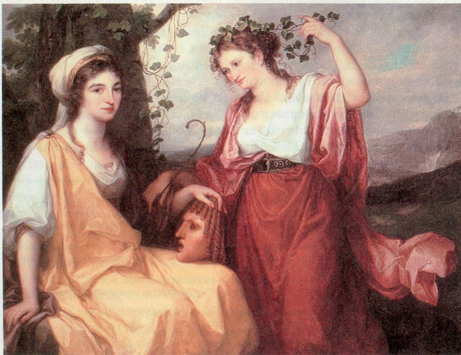
Nicht ohne Grund nennt man Angelika Kauffmann den weiblichen Raffael der Kunst und meint damit auch den Themenschwerpunkt, den sie auf mythologische Szenen legte. Hier ihr Bildnis der «Tragödie und Komödie» aus dem Nationalmuseum Warschau, zurzeit in Chur.

■ Die Ausstellung im Zoologischen Museum Zürich dauert bis zum 29. August. Öffnungszeiten: Di bis Fr 9–17 Uhr, Sa und So 10–16 Uhr, 01 634 38 38.