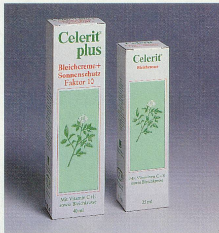
Schutz vor Pigmentflecken

Ihr gepflegtes und attraktives Aussehen ist Ihnen wichtig. Wären da nur nicht diese ärgerlichen Flecken auf Ihrer Haut. Grund genug, jetzt etwas gegen Pigmentflecken zu tun. Fragen Sie deshalb nach Celerit. Diese zuverlässige und sanft wirkende Creme wird bei Pigmentflecken von Fachpersonen empfohlen. Und das mit gutem Grund, denn Celerit bedient sich eines Fünffach-Wirkkomplexes von Aktivstoffen, die sich ideal ergänzen. Vitamin C und Bleichkresseextrakt hemmen die Entstehung neuer Pigmentflecken und fördern gleichzeitig den Abbau bestehender Flecken. Vitamin E beschleunigt den Abtransport überschüssiger Pigmente. Dexpanthenol dient der Rege-