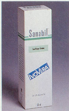
Feuchtigkeits-spender für die trockene Haut

Trockene Haut wird bei warmem Wetter und bei starker Sonneneinstrahlung zusätzlich strapaziert. Es wird ihr die für ihre Schutzfunktion notwendige Feuchtigkeit entzogen. Die Haut wird spröde, verliert ihre natürliche Spann-