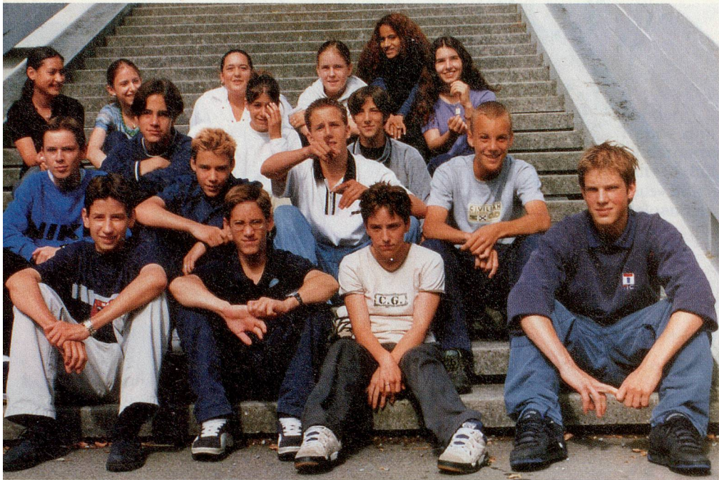
2. Sekundarklasse des Schulhauses Dölttschihalde in Zürich.