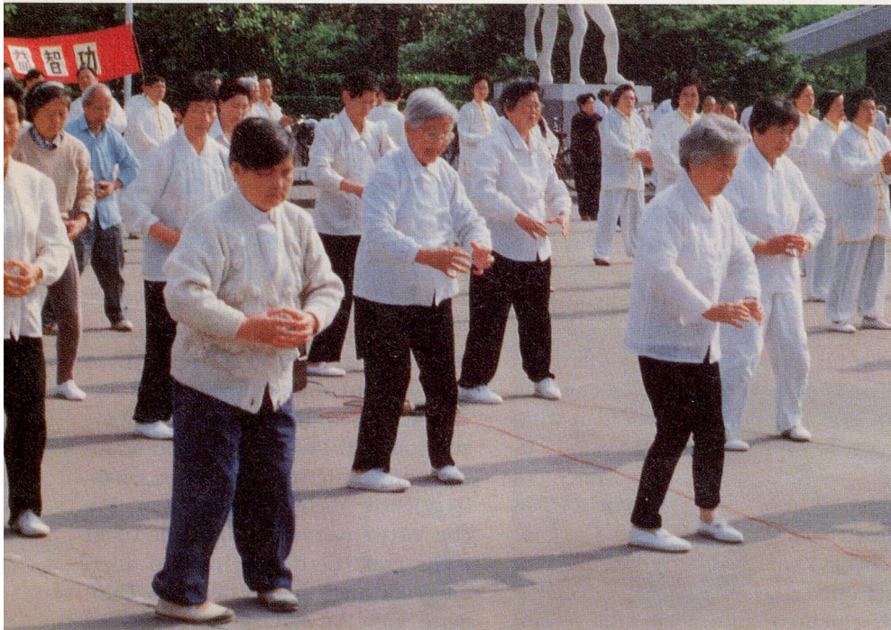
Bewegungslos hält die chinesische Seniorengruppe die Übung durch.