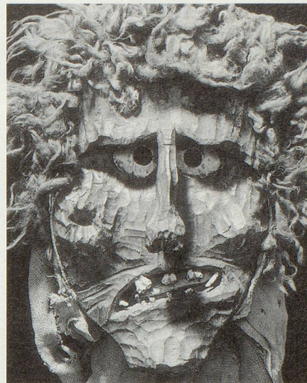
Eine der urchigen Lötschentaler Masken aus der Sammlung des Rietbergmuseums Zürich.

Sie gilt weithin als archaisches, gewissermassen urschweizerisches