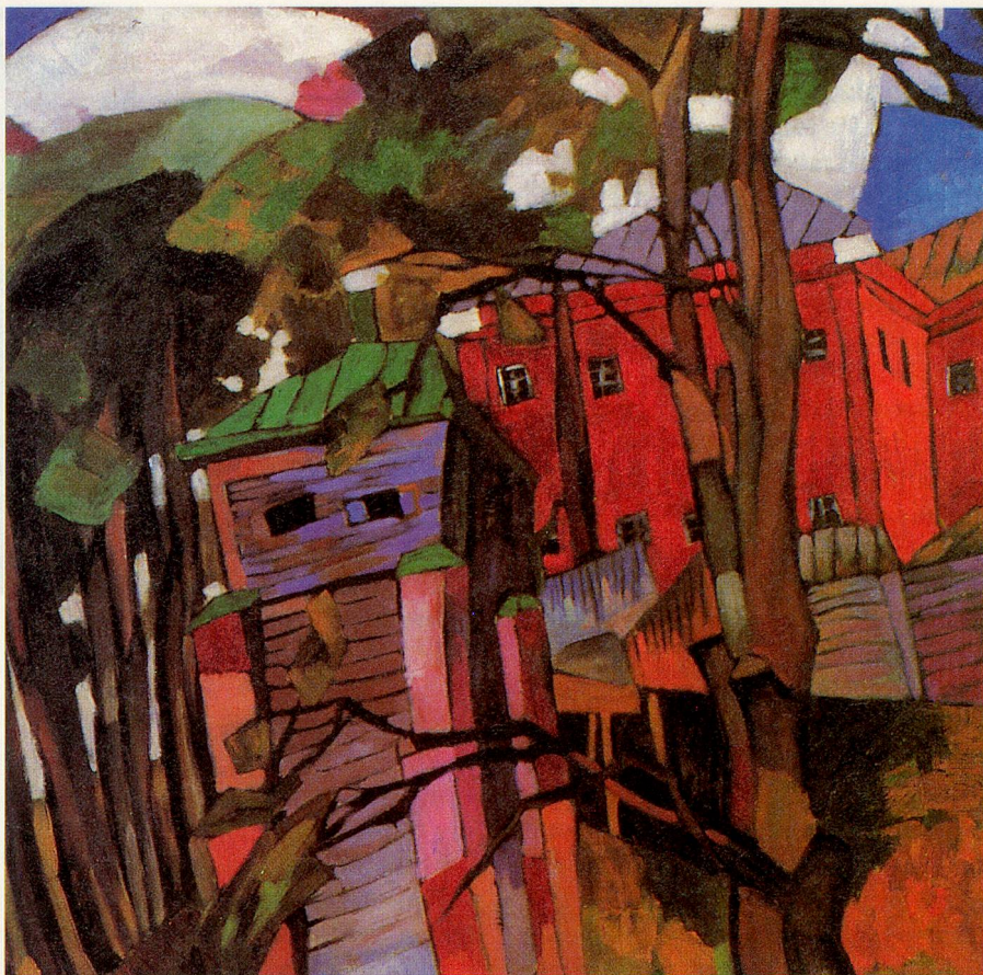
«Landschaft mit rotem Haus» von Aristarch Lentulow aus dem regionalen Kunstmuseum Samara. Ein russisches Bild von 1917, nach kubistischem Vorbild, doch in strahlender volkstümlicher Farbigkeit.

■ Parallel zur Ausstellung «Miami Islet» ist in dem in der Vermittlung aktueller Kunst zum Begriff gewordenen Kunstmuseum des Kantons Thurgau eine umfassende Werkübersicht der Fotografin Simone Kappeler zu sehen. Die Öffnungszeiten: Mo bis Fr 14–17 Uhr, Sa und So 11–17 Uhr; 052 748 41 20.