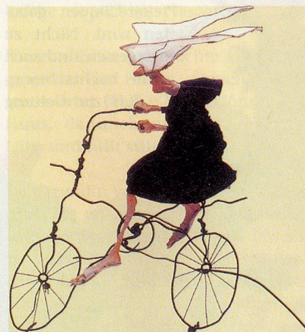
Die Skulptur «Beschwingter Ausritt» von Hanspeter Kamm.

«Ab in den Raum!» lautet der Befehl, der in dieser neuen Ausstellung den zweidimensionalen Cartoonfiguren gegeben wurde. In der Dreidimensionalität überraschen sie die Betrachtenden mit ihrer Räumlichkeit und neuen Ansichten. Lebendig und witzig sind diese Skulpturen, einige mit einer Prise Ernsthaftigkeit, da es im Leben nicht immer nur lustig zu- und hergeht. Die Erschaffer der Gestalten sind vier bekannte Schweizer Cartoonisten und