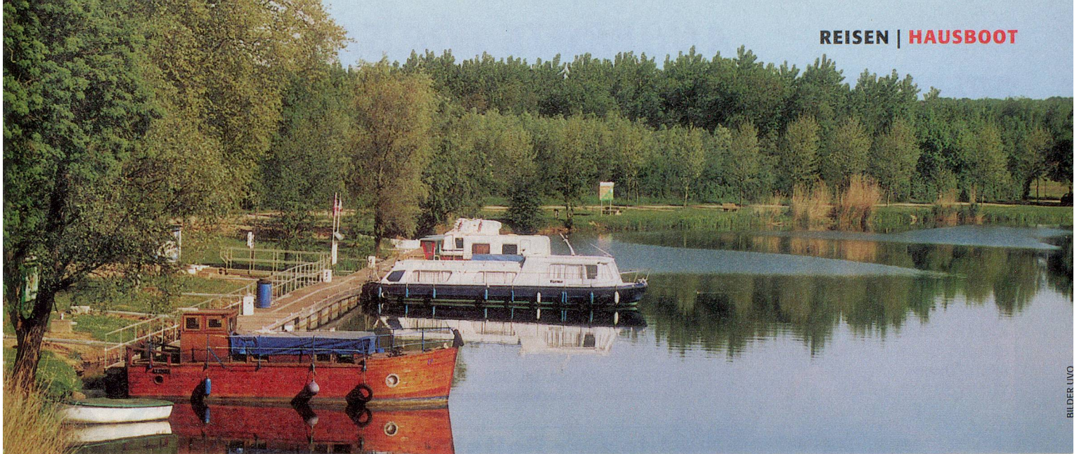
Der kleine Hafen von Cuisery an der Seille. Diese fließt durch den zum Burgund gehörenden Teil der Bresse.

Campagne und Paté Crouté, die frischen Baguettes, die wir am Morgen in einer Bäckerei eingekauft haben, den Weichkäse und eine Flasche Rosé aus der Gegend. Es riecht nach Frühsommer. Um uns herum blühen Hahnenfuss und Kerbel; Lava, unser Hund, wälzt sich im hohen Gras. Wie Hintergrundmusik ist ständiges Vogelgezwitscher zu hören, beharrlich übertönt vom Ruf des Kuckucks.