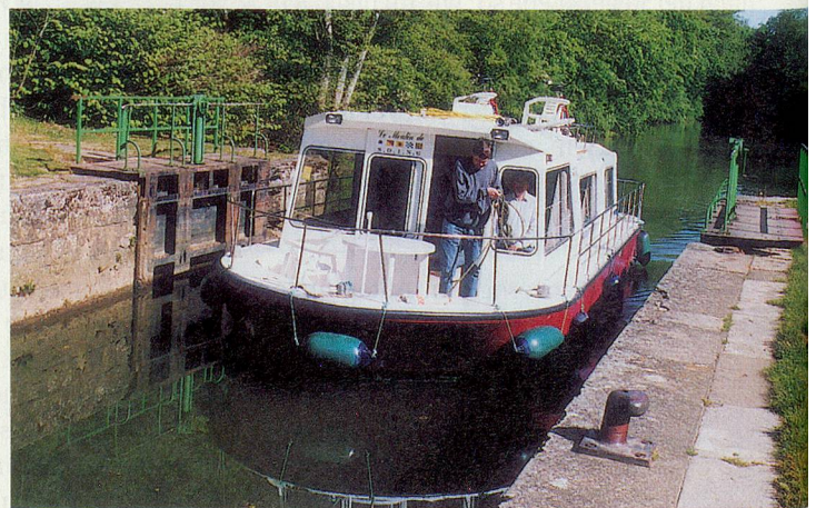
Sorgfältig wird das Boot ins Schleusenbecken gesteuert.

Wir binden das Boot an die Eisenpflöcke, die wir mit einem Hammer in den Boden geschlagen haben, und schleppen den Plastiktisch und die -stühle vom Schiffsdeck hinaus auf festen Boden. Danach decken wir auf: Paté de