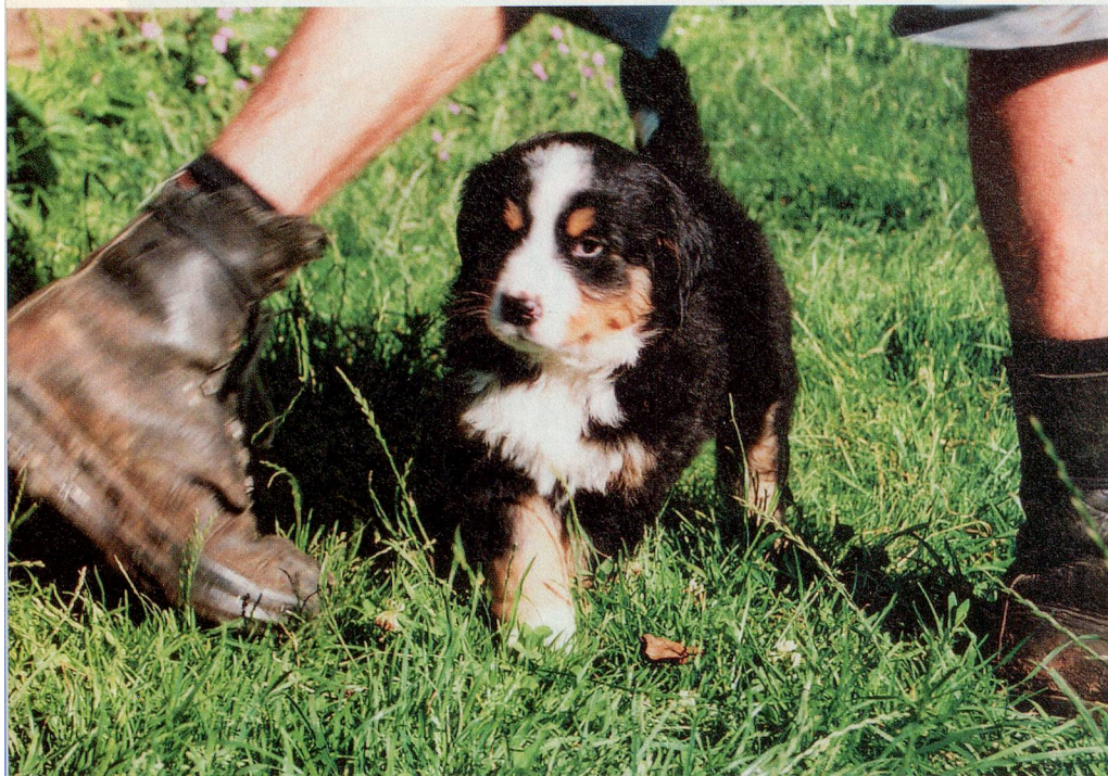
Einer der Welpen vom Breite-Hof: Menschen können Jungtieren kaum widerstehen.

mehr als Pfotenabdrücke im Eingang, Kratzspuren an der Tür, Tierhaare auf dem Sofa, Spaziergänge bei jedem Hudelwetter, Robidog-Säcke in allen Taschen und der muffige Geruch von Katzenklos: «Tiere schenken einem mehr, als man ihnen geben kann», sagen Hunde- und Katzenbesitzer.