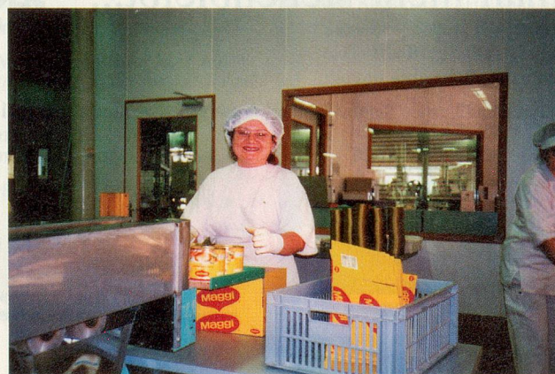
Diese Arbeit wird bald im Ausland ausgeführt.