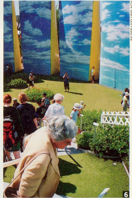
BILDER UVO UND AGH

1: Eine feucht-fröhliche Angelegenheit ist die Wolke von Yverdon. Die hellblauen Pelerinen schützen vor den Wassertröpfchen aus 33 000 Düsen.