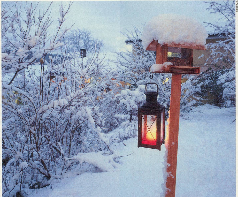
Füttern im Winter: Die einheimischen Vögel lassen sich aus der Nähe beobachten.

In kleinen Mengen zu füttern, schadet aber auch nicht. Mit einer massvollen Fütterung lassen sich die findigen Vögel des Wohnquartiers gerne in den Garten oder vor das Fenster locken. Das eröffnet vielen Menschen eine einmalige Gelegenheit, die einheimischen Vögel aus der Nähe zu sehen. Obschon die anpassungsfähigen Arten mit wenig Scheu vor dem Menschen die grosse Mehrheit am Futterbrett bilden, findet sich oft eine überraschende Vielfalt an gefiederten Gästen ein. Stammgäste sind gewiss die Spatzen, Kohl- und Blaumeisen, Buchfinken, Grünfinken und Amseln. Aber auch einzelne Buntspechte, Gimpel oder Kernbeisser, Kleiber oder Rotkehlchen treffen vielleicht aus nahe gelegenen Wäldern ein. In einzelnen Jahren darf man damit rechnen, den hübschen Seidenschwanz mit seinem pastellfarbenen Gefieder oder den kontrastreich gefärb-