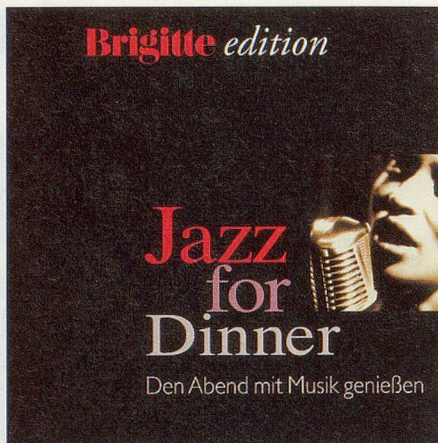
Jazz for Dinner, Brigitte Edition Universal 584 056-2, CHF 32.50

Szenenwechsel: Softsänger Terry Callier besingt in «Coyote Moon» die Einsamkeit. Pianistin und Sängerin Shirley Horn greift dieses Thema ebenfalls auf, unterlegt mit Streichern und raffiniert gesungen. Sie schafft die Stimmung für einen verträumten Walzer, kühl interpretiert von der Sängerin Silje Nergaard.