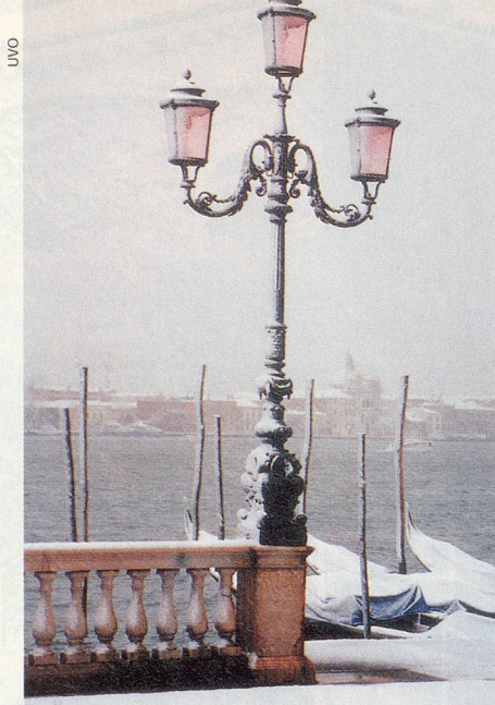
Blick auf ein verschneites Giudecca.

Am nächsten Tag ist es noch kälter. Der Schnee hat sich festgesetzt und ist gefroren. Einige japanische Feriengäste schlittern mit Plastiksäcken voller Murano-Glaswaren über die Piazza San Marco, wo die Tauben aufgeplustert am Boden und auf den Bänken hocken. Ein