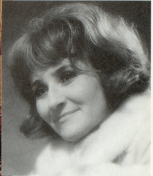
Die «Märchenkönigin» in jungen Jahren

Was Kinder mögen, weiss sie genau. Tiergeschichten, Geschichten, bei denen man mitfiebern kann, lustige Geschichten. Eben hat sie das Märchen vom Frosch mit der Trompete entdeckt, «De Güggel ufem Chiledach» wieder neu herausgebracht. Sie mag auch schöne alte Geschichten, die ein bisschen in Vergessenheit geraten sind, wie etwa das «Rosenresli» oder «Gullivers Reisen», die sie wieder ans Tageslicht holt. Zu ihren absoluten Lieblingsgeschichten gehören das «Dschungelbuch» und der Klassiker «Nussknacker und Mausekönig» von E.T.A. Hoffmann. Für ihre Kassetten hat