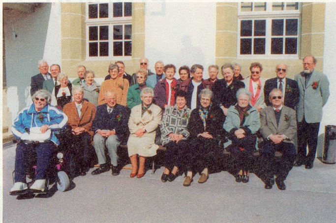
Die Konfirmanden von damals – 50 Jahre später.