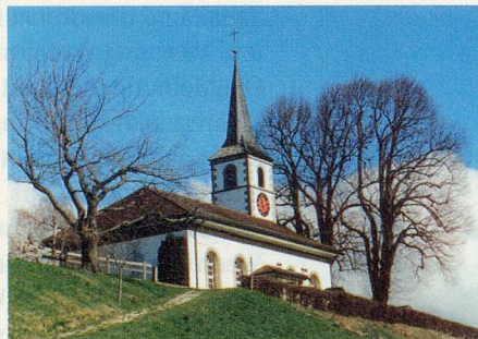
Kirche Rüscheegg am Palmsonntag 2002.

Wohl die meisten der anwesenden ehemaligen Konfirmandinnen und Konfirmanden folgen in Gedanken ihrem Lebensweg zurück bis zu ihrer Konfirmation vor fünfzig Jahren. «Es isch scho ygfahre», sagt nach dem Gottesdienst