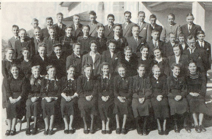
47 junge Menschen auf der Konfirmationsfoto von 1952.