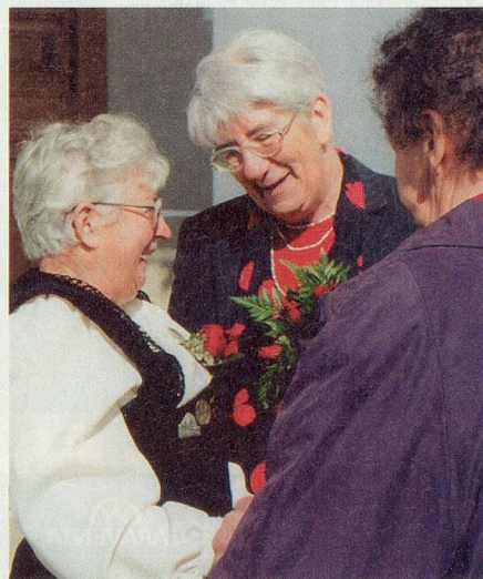
Wiedersehen vor der Kirche: Die ehemaligen Konfirmandinnen und Konfirmanden sind schon bald in ein Gespräch vertieft.

dene Konfirmation drückt Würdigung und Anerkennung der Kirche gegenüber älteren Menschen aus und ruft in Erinnerung, dass die Kirche in einer Lebensphase, die geprägt ist von loslassen und neu beginnen, ein hilfreiches Gegenüber sein möchte.» So steht es in der Dokumentation, welche die Reformierten Kirchen Bern-Jura herausgegeben haben.