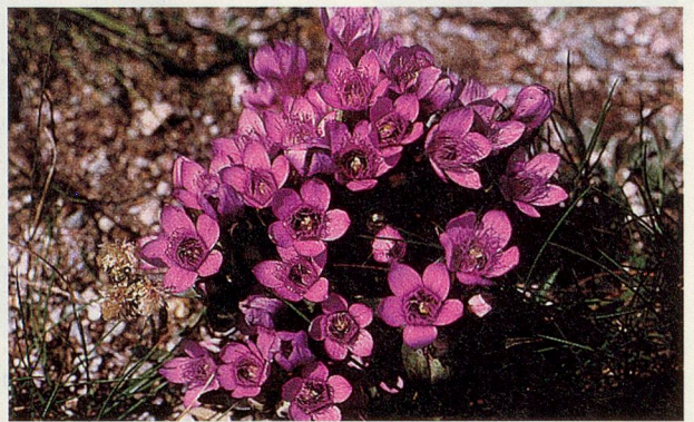
Den Deutschen Enzian gibt es in drei Unterarten, hier blüht in intensivem Lila der Rätische Enzian.

Welch einen Reichtum an Tier- und Pflanzenarten diese Gegend zu bieten hat, wurde am zweiten Artenschutztag der Zeitschrift GEO klar. Während 24