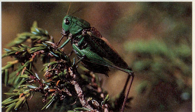
Bei den Warzenbeissern ist Vorsicht geboten: Sie können mit ihren Mundwerkzeugen beachtlich zwicken.

Stunden untersuchten verschiedene Spezialisten ein Gebiet, das sich von den Hängen oberhalb der Alp Flix bis nach Sur erstreckte. Dabei entdeckten sie 2092 Pflanzen- und Tierarten. Verglichen mit Zählungen aus anderen Gebieten in Deutschland, Österreich und der Schweiz ist dieser Artenreichtum rekordverdächtig. Neben 69 Vogelarten, 16 Säugetieren, 174 Fliegen- und Mückenarten wurden auch 150 Algen und 188 Flechtenarten bestimmt. Eine kleine Dungmücke wurde hier sogar neu entdeckt, und einige Arten waren vorher noch nie in der