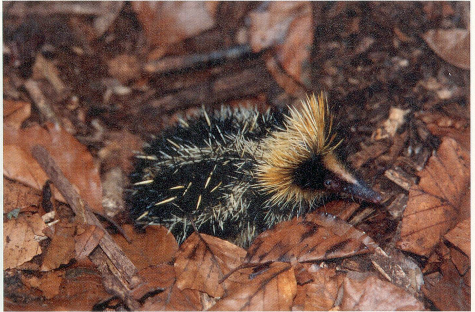
Alle Tiere bewegen sich frei in der Regenwaldhalle. Hier der Tanrek, ein Borstenigel.

Auch für die Besucherinnen und Besucher wird das Zoo-Erlebnis ohne Glas und Gitter neu sein. «Die Tiere sollen nicht auf dem Tablett präsentiert werden, sondern in ihrem natürlichen Lebens-