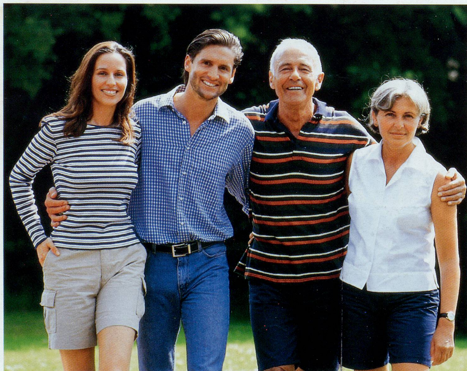
Sich rascher verständigen, sich besser verstehen – dank Siemens Triano.

Mit Triano können Sprachsignale noch besser erkannt und aus den Umgebungsgläuschen herausgefiltert werden – selbst wenn beide im gleichen Frequenzbereich liegen! Zusammen mit der ConTrast-Funktion zur künstlichen Verbesserung der Artikulation ergibt sich daraus ein nochmals stark verbesserter Sprachwahrnehmungs-Komfort.