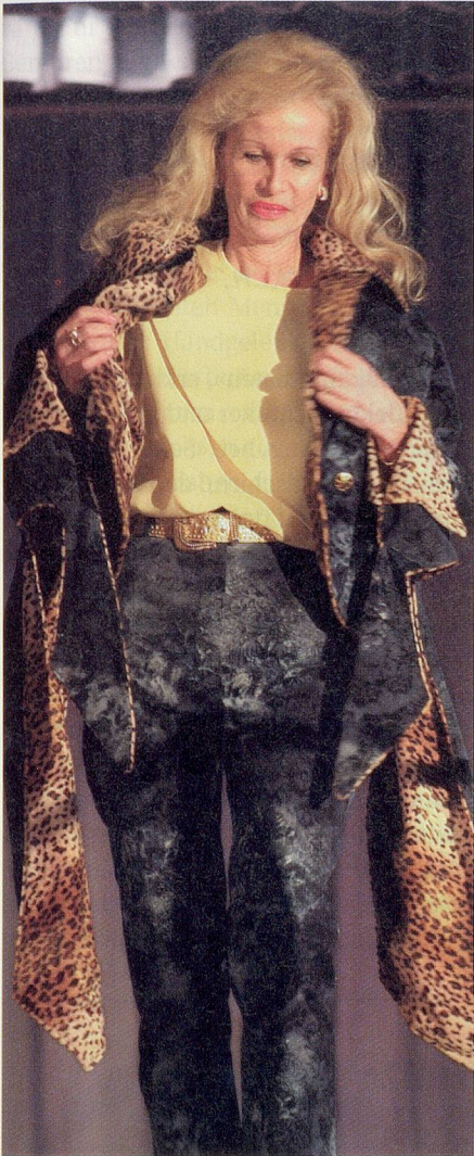
Auftritt in mondäner Jeans-Samt-Hose mit Blumendruck und wendbarem Cape mit Leopardmuster.