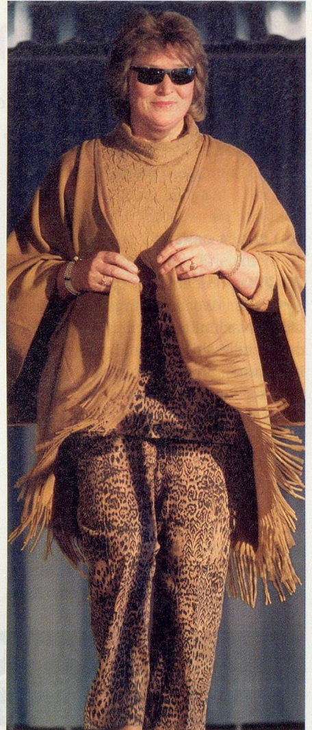
Ganz schön «in» sind Stoffe mit Raubtierdruck – am Oberteil kombiniert mit Rippenstrick.

Epochen – alles um die superschlanken Schönheitsköniginnen des internationalen Laufstegs von Mailand bis New York. Dabei scheint der Jugendlichkeitswahn auch bei den Normalsterblichen immer grössere Kreise zu erfassen. Neuerdings aber entdecken selbst Stardesigner die «neuen Alten» als gewinnbringende Werbeträger für ihre Kreationen. So gibt es inzwischen auch mal grauhaarige Herren und über 70-jährige Damen auf Plakaten und Laufstegen. Noch sind das allerdings Ausnahmen, die Aufsehen erregen.