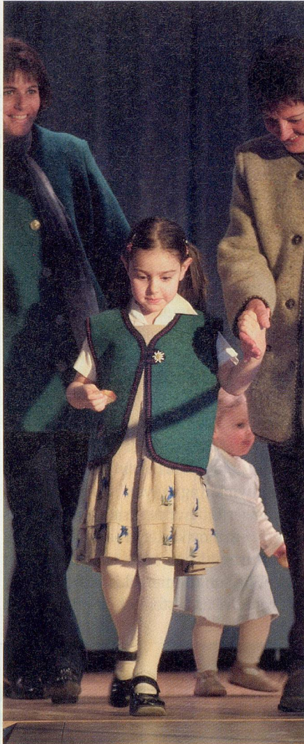
Generationen-Trio im Loden-Look. Auch das Enzian-Kleid samt Blüschen hat das Grosi für die Enkelin genäht.